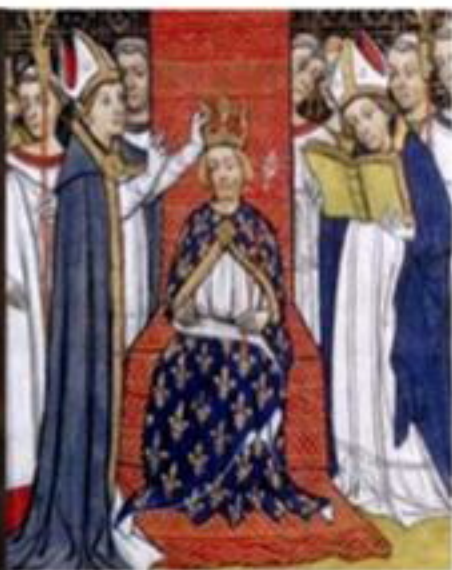
Philippe III le Hardi

Fils de Louis IX et de Marguerite de Provence