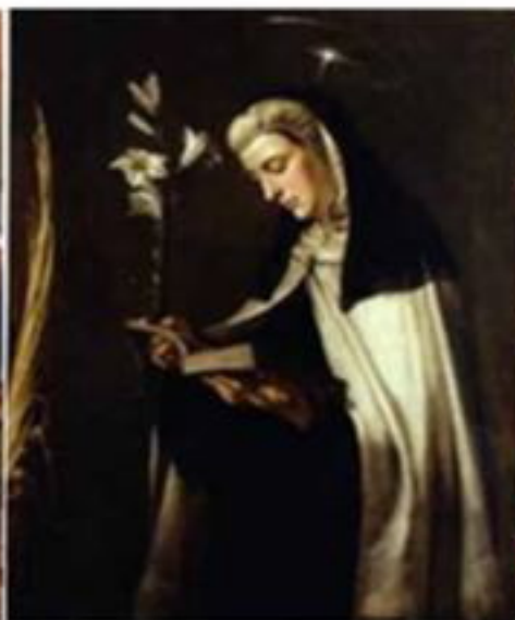
Jeanne de Toulouse

Fils de Louis VIII et de Blanche de Castille