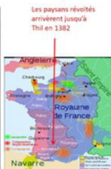
Gaston Fébus, Pierre TUCCO-CHALA