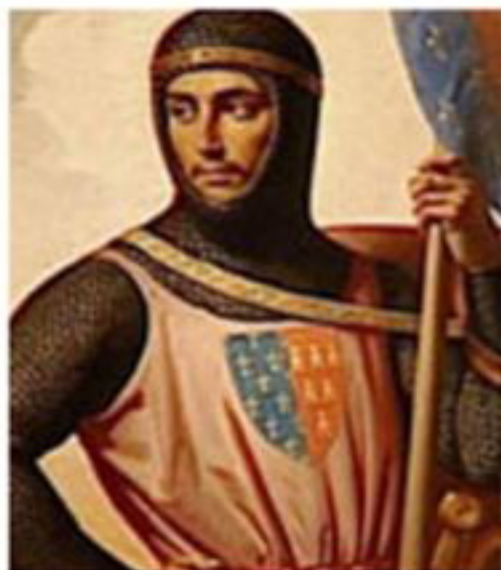
Alphonse de Poitiers

Fils de Louis VIII et de Blanche de Castille